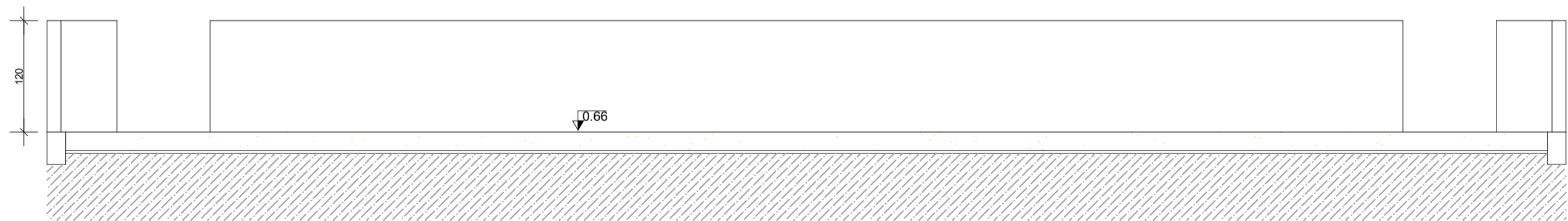
CORTE AA ESC. 1:50